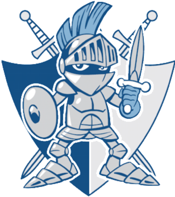
Escuderos (Grados K-5º)